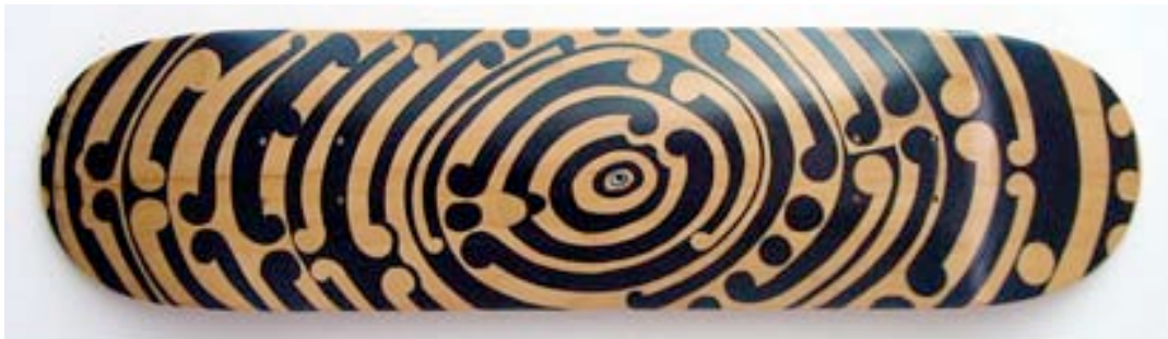
Michel Tuffery, Koru Bling Bling , 2004

Pasifika Styles is een belangrijk tentoonstellingsproject dat plaatsvindt in Cambridge (Verenigd Koninkrijk) vanaf mei 2006 tot en met februari 2008 en dat Maori en Polynesische kunst en cultuur belicht.