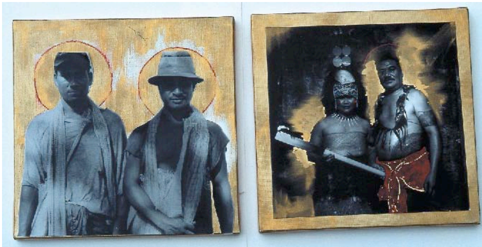
Greg Semu, Untitled, 2003

In april 2007 zullen de activiteiten - het "kloppend hart" van het project – culmineren in een festival van Polynesische kunst met theater, muziek en dansopvoeringen in Cambridge.