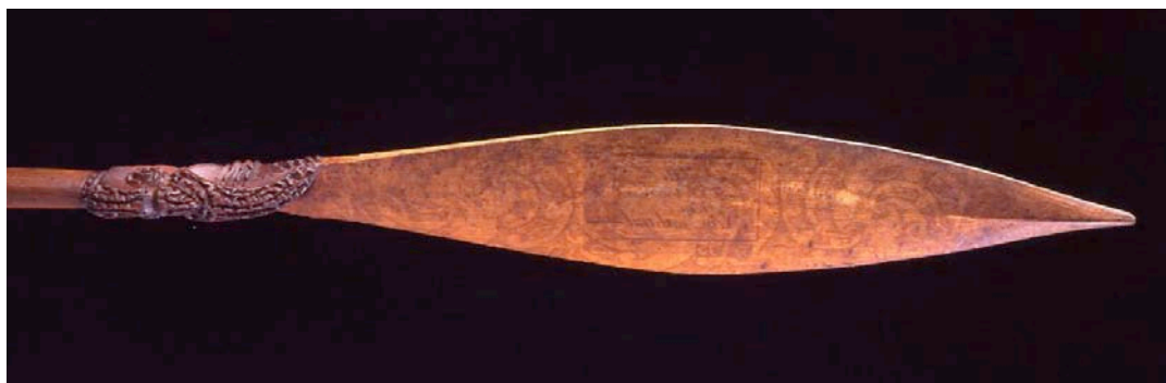
Maori roeispaan uit Nieuw-Zeeland, verzameld door kapitein James Cook in 1771. CUMAA D.1914.66

Gedurende achttien maanden wordt het werk van toonaangevende kunstenaars die in Nieuw-Zeeland leven, tentoongesteld. Daarnaast worden de buitengewone historische verzamelingen van het Cambridge Universiteitsmuseum voor Archeologie en Antropologie (CUMAA) in de kijker geplaatst.