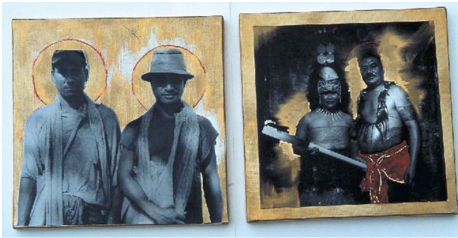
Greg Semu, Ohne Titel, 2003

Das lebendige Herz des Projektes wird in einem einwöchigen Festival für Pazifische Kunst mit Theater, Musik und Performances im Frühjahr 2007 gipfeln.