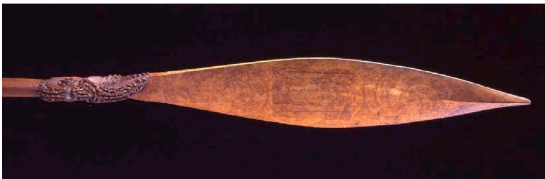
Maori Ruder aus Neuseeland, gesammelt von Kapitän James Cook in 1771. CUMAA D.1914.66

In den Räumen des Museums für Archäologie und Anthropologie der Universität Cambridge (CUMAA) präsentiert die Ausstellung Arbeiten führender Künstler aus Neuseeland , sowie Glanzstücke der einmaligen Ozeaniensammlung des Museums noch mindestens bis zum Februar 2008.